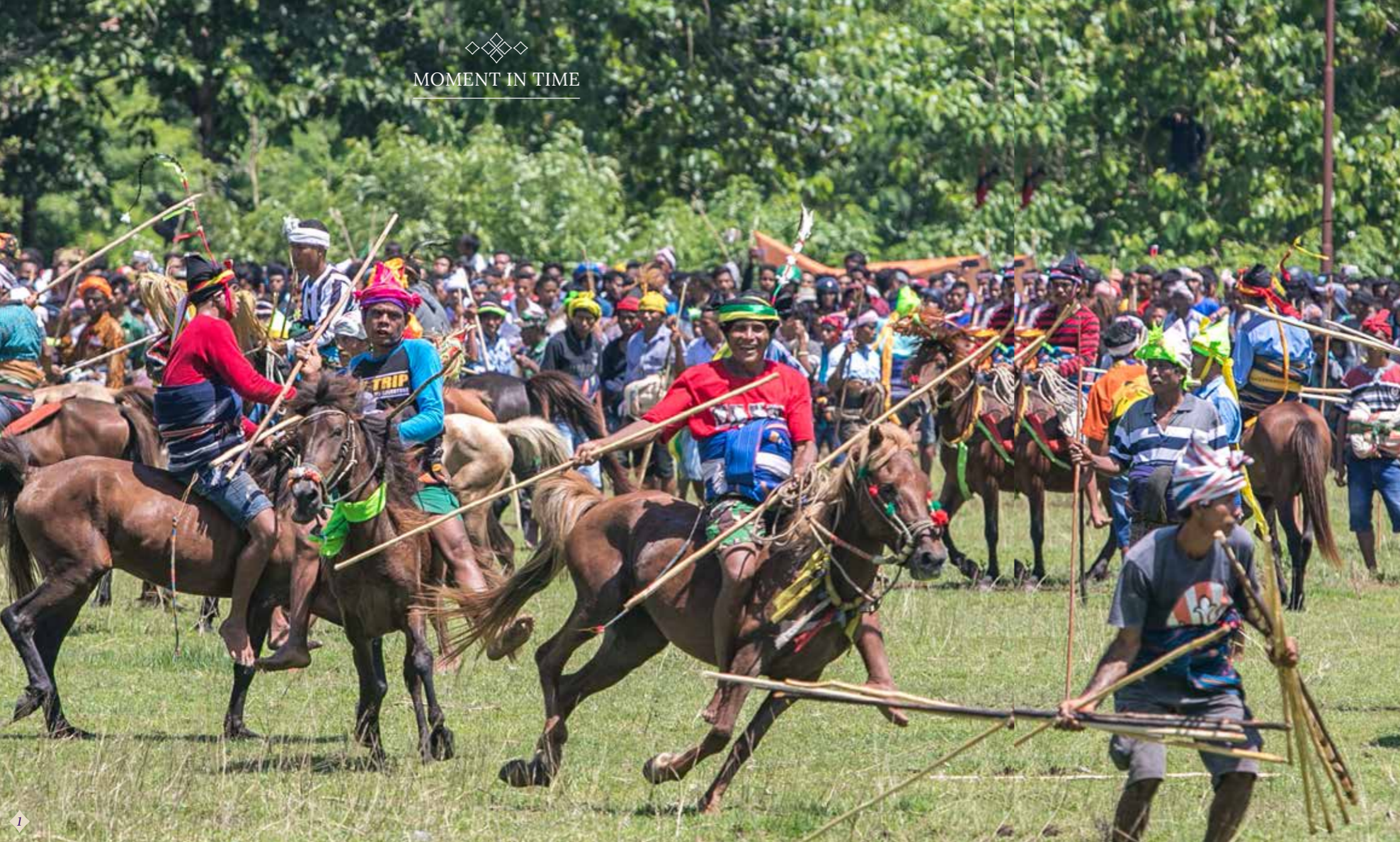
1. The Pasola Festival is held over four weeks in February and March.