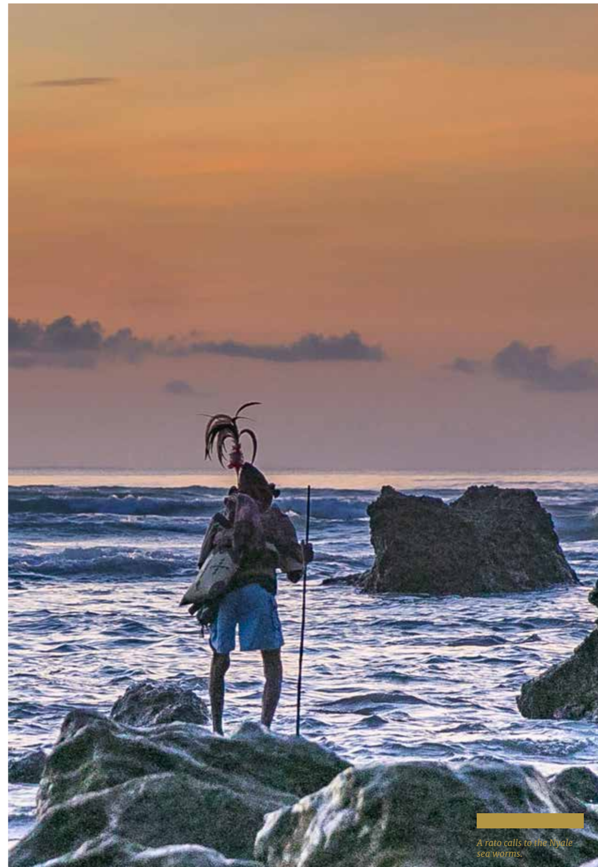
A rato calls to the Nyale sea worms.